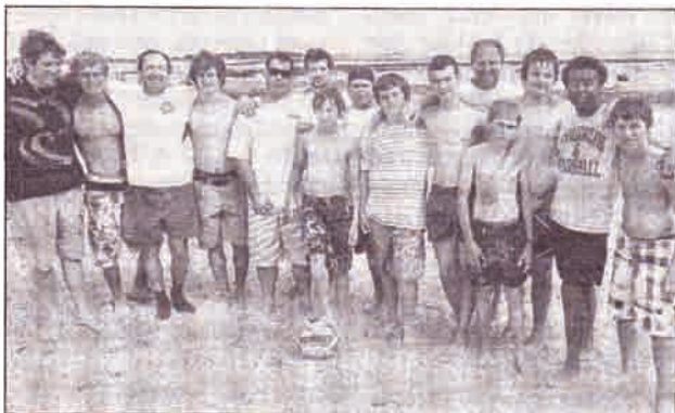
Deux des équipes engagées dans le tournoi de beach rugby sur la plage de Port de Bouc à Kéerty.

Le Rugby club bigouden (RCB) a réussi une belle petite fête, samedi, sur le sable de la plage de Port de Bouc à Kéerty, en organisant un tournoi de beach rugby. Une soixantaine de joueurs s'étaient inscrits. C'était la deuxième édition estivale de cette animation, après celle du 30 juillet à l'Île-Tudy.