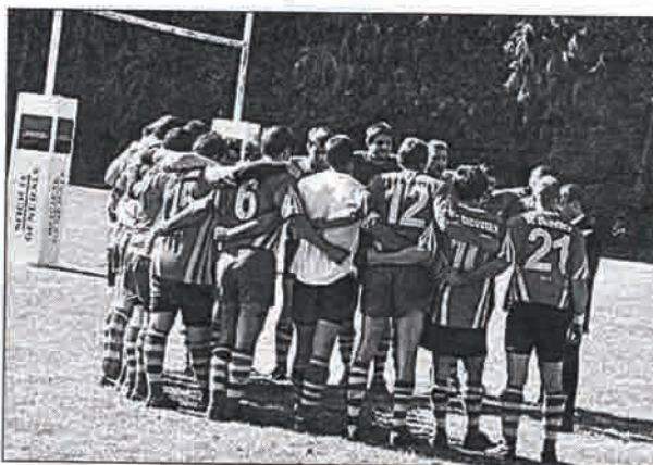
Les Bigoudens du RCB entendent bien prendre les points de la victoire dimanche, chez eux, contre Dinan qui, comme eux, occupe la troisième place du championnat.

Trois, comme le nombre de semaines restées sans jouer. Trois, comme le nombre de victoires que le RCB entend afficher à l'issue d'une rencontre qui d'ores et déjà s'annonce serrée. Après une première sortie victorieuse à