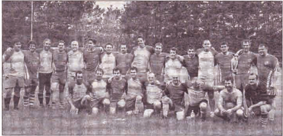
Les rugbymen du RCB et des Breizh Barians, accompagnés de Moustique.

La rencontre était placée sous le signe de la convivialité et du jeu, sans aucune pression. Et cela s'est ressenti : « Les joueurs rigolent, se tapent dans le dos. En match officiel, ils sont beaucoup plus sérieux », confirmait une spectatrice habituée des terrains, qui, comme de nombreux fidèles de Tréouguay, avait fait le déplacement à Treffiagat.