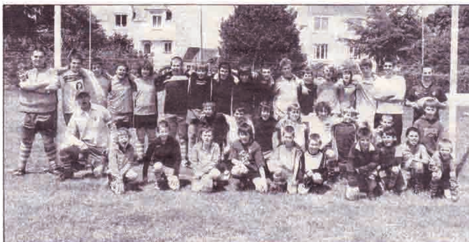
Une quarantaine de jeunes joueurs, dont une quinzaine de nouvelles recrues, se sont retrouvés samedi, à Tréouguay, pour la dernière séance de l'école de rugby.

Consolider l'acquis, mais aussi poursuivre le développement et l'ouverture du club, deux axes forts évoqués dimanche à Tréouguay lors de l'assemblée générale du Rugby-club bigouden.