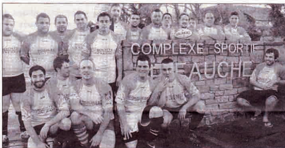
Derniers moments au stade Jean-Pierre-Fauché pour les rugbymen.

Que va-t-on faire dimanche ? On va voter, bien sûr ! Oui, mais à Pont-l'Abbé, au stade Jean-Pierre-Fauché, on vote aussi rugby, à l'occasion du dernier match de la saison à domicile, du club bigouden.