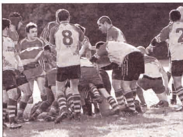
Les Bigoudens du Rugby club accueillent aujourd'hui leurs homologues de Carhaix sur la pelouse du stade Jean-Pierre Fauché.

Sur le pré, gras voire très gras, du stade Jean-Pierre Fauché,