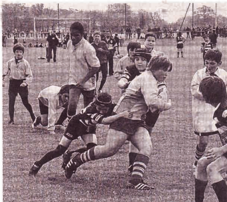
L'école de rugby s'entraîne encore ces deux premiers samedis de juin.

La saison de rugby s'achève au Rugby-club-bigouden. L'école de rugby fait exception. Elle s'entraîne encore, ces deux premiers samedis de juin, au stade Jean-Pierre-Fauché de Tréouguy, à Pont-l'Abbé.